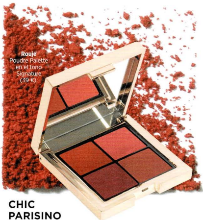
Rouje Poudre Palette en el tono Signature (39 €).